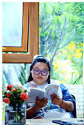
▲ 知识是进步的阶梯