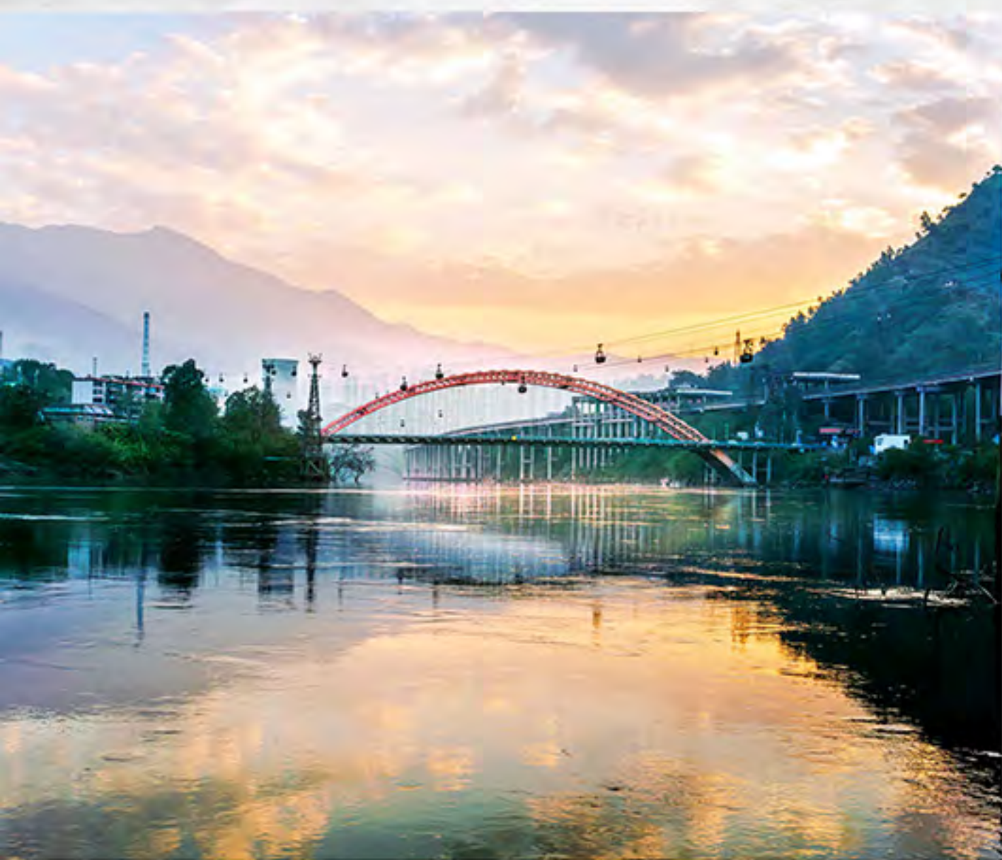
华荣 洪计恩 摄